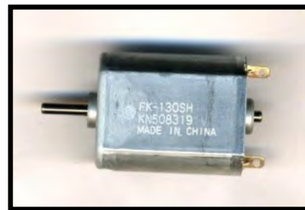
Typischer Vertreter des Poolmotortyps