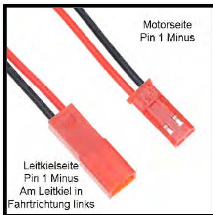
Pin-Belegung der NASCAR Poolmotoren

In einigen Serien wird mit Poolmotoren gefahren, ausgerüstet mit 10er Ritzel und BEC Stecker. Motortyp FK-130SH (Fox10 Ersatz).